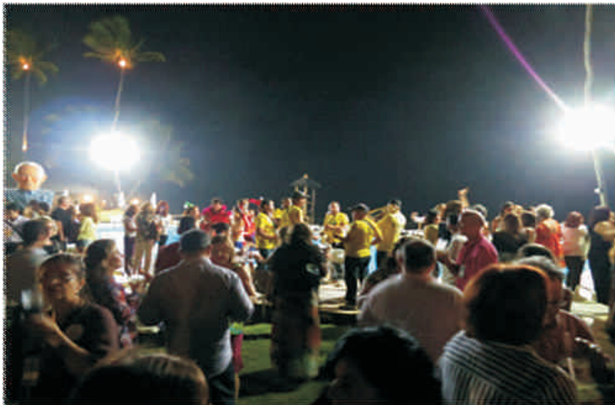
PORTO DE GALINHAS, PERNAMBUCO, BRAZIL

TRADUCCIÓN: BLANCA PERAL INSTITUTO MADRILEÑO DE ANÁLISIS BIOENERGÉTICO (IMAB)