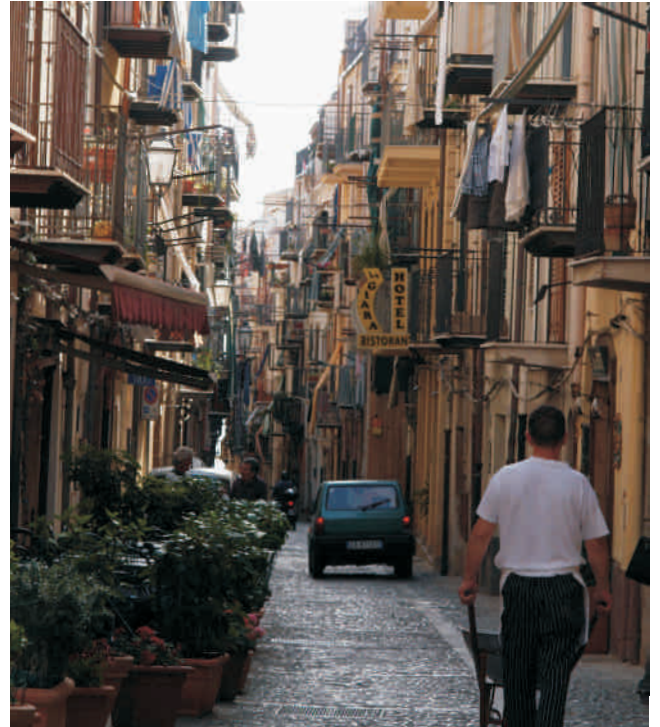
IIBA Conference in Sicily 2013