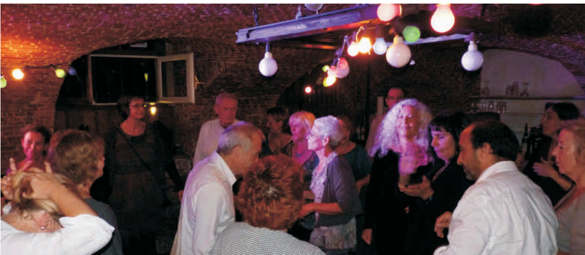
Work and fun The French speaking days of Bioenergetik Analysis