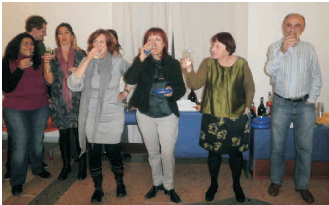
La rencontre avec des Collègues du SIAB

FINA PLA SECRETAIRE DE L'EFBA-P ASSOCIACIO' CATALANA EN L'ANALISI BIENERGETICA (ACAB) TRADUCTRICE : FRANCE KAUFFMANN