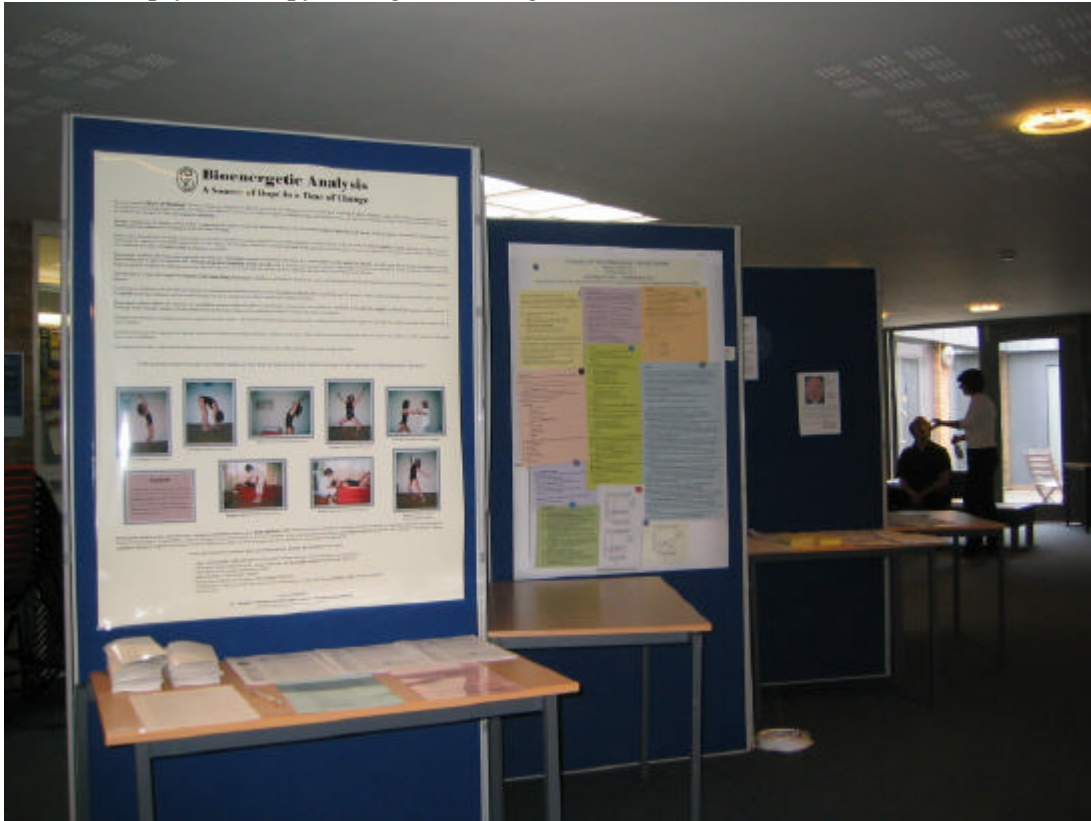
Our poster and documents about Bioenergetic Analysis on display at the Congress hall" "Nuestro póster y documentos sobre el Análisis Bioenergético expuestos en el hall del Congreso""

become a standard procedure in all congresses about psychology or psychotherapy, so that B.A. becomes a well known form of psychotherapy among our colleagues.