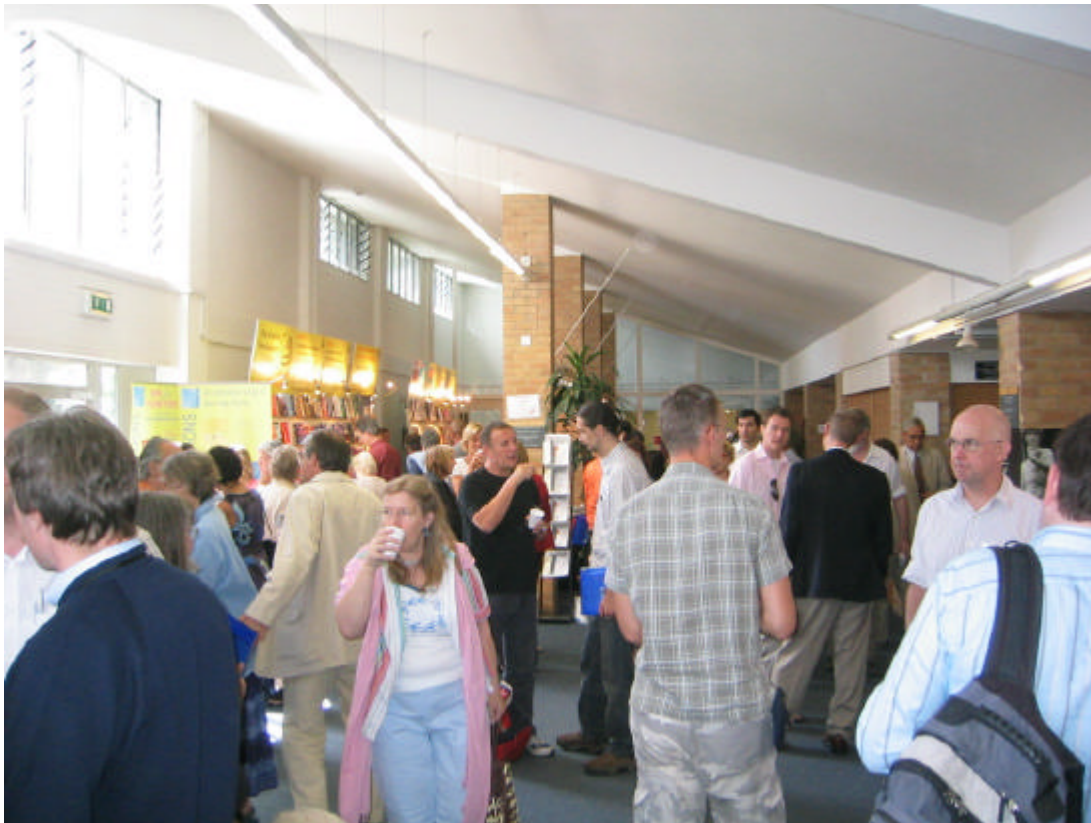
"Participants in the congress during a coffee brake"