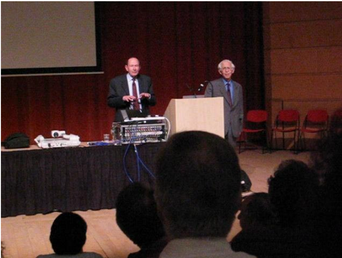
“Nobel laureate Gerald Edelman (left) and the Nobel laureate from Cambridge University who introduced him” “El premio Nobel Gerald Edelman (izquierda) junto al premio Nobel de la Universidad de Cambridge que le presentó”

The theme of the congress was “Days of Shaking”: Psychotherapy in a time of change. This has been a very well organised congress with interesting speakers. One of them was Nobel laureate Gerald Edelman who was himself introduced by another Nobel laureate from Cambridge University. I think that the event has meant a backing for EAP recognition as a serious institution representing psychotherapy in Europe. Unfortunately, as usual, there were at some times EAP meetings parallel to the activities of the congress for which reason I only attended part of it.